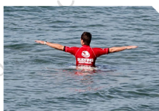
分數排名狀況 Score Situation