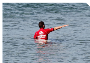
浪數統計 Wave Count