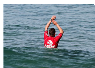
剩餘的時間 Time Remaining